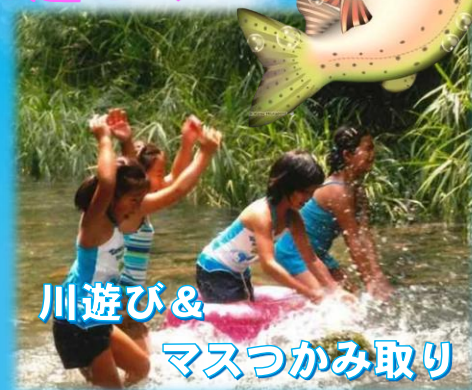
川遊び & マスつかみ取り