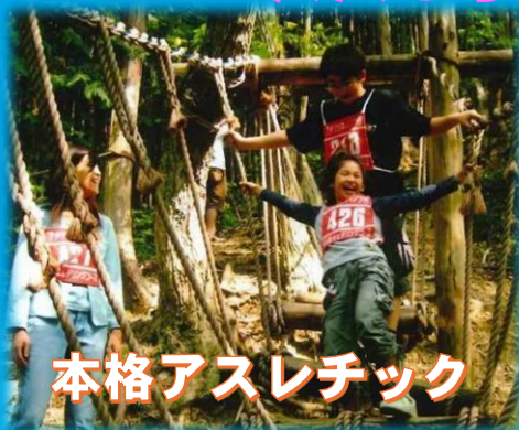
本格アスレチック